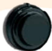
Serratura a combinazione